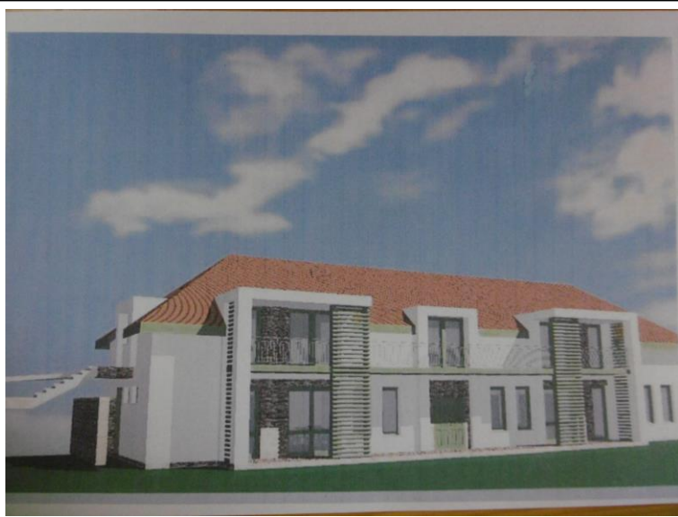
Előzetes látványterv a megvalósulandó épületről