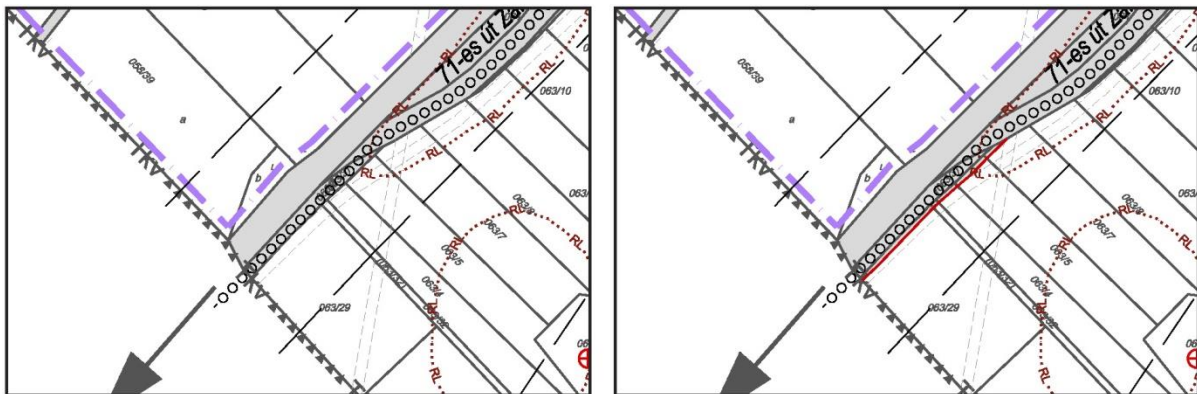
Szabályozási terv részlete (tervezet) Szabályozási terv részlete (módosított tervezet)

A tervezett módosítás a 71. sz. főút melletti szabályozási vonal vonalvezetésének módosítása. Ez a közterület szélességének növelését jelenti, 110 m hosszon, átlagosan 2,5 m-rel.