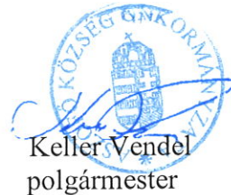
Keller Vendel polgármester