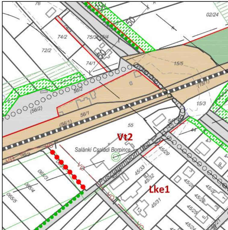
1.ábra: hatályos szabályozási terv kivágat (Aszófő 54, 55 hrsz)